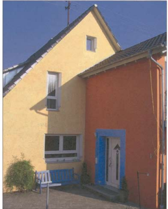
Die prämierte Fassade in Karlsbad-Langensteinbach.